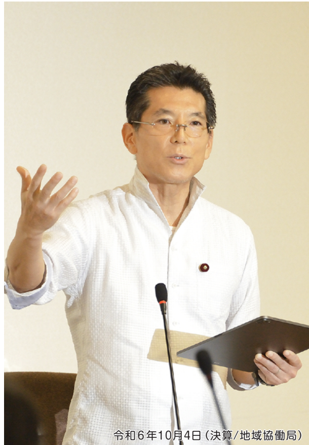
令和6年10月4日(決算/地域協働局)