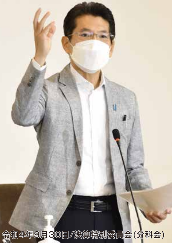
令和4年9月30日/決算特別委員会(分科会)