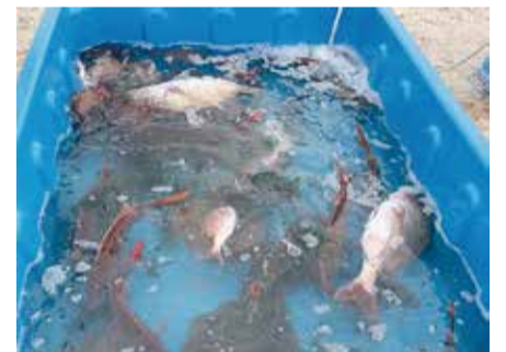
(須磨海岸の地引き網体験会)