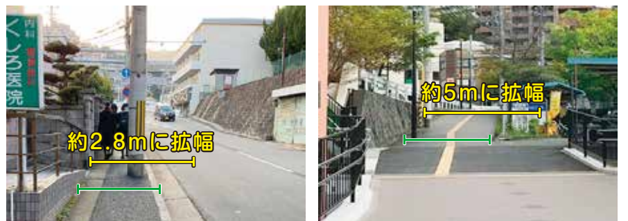
妙法寺駅~桜の杜(歩道)