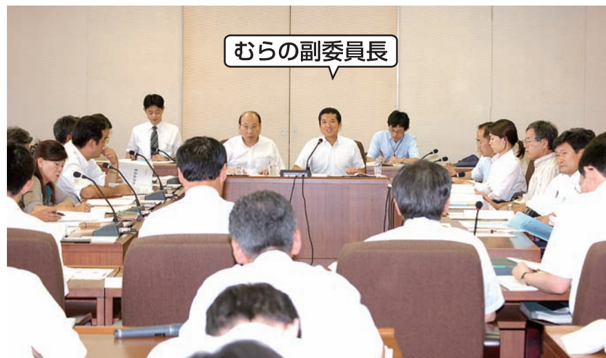
大都市税財政制度確立委員会